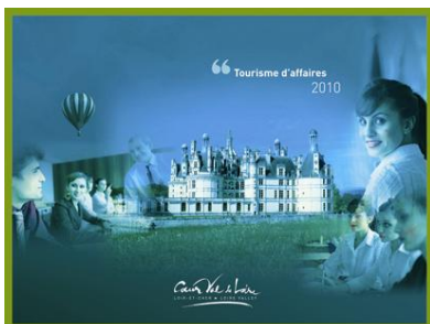
Brochure Tourisme d'affaires 2010