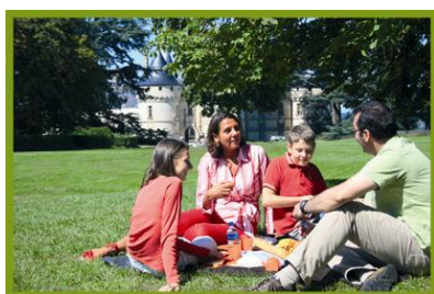
Développement de l'offre famille

→ Les familles constituent la 1ère clientèle du département, elles représentent plus de 40 % des visiteurs