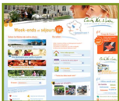
Site dédié aux séjours