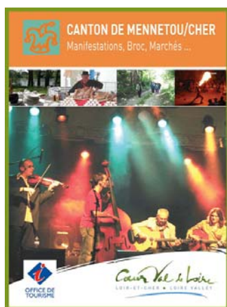
Exemple d'utilisation de la charte par un prestataire