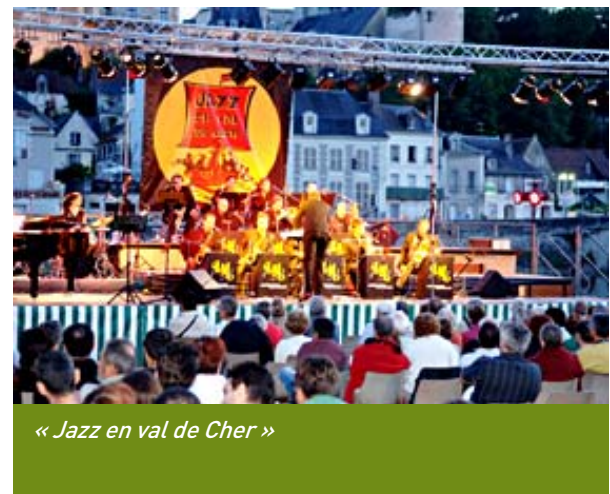
« Jazz en val de Cher »

Arrive ensuite l'été, le temps des festivals. Les amateurs de musique classique iront à Pontlevoy, ceux de jazz à Saint-Aignan (Jazz en val de Cher), à Cheverny (Jazzin' Cheverny) ou à Salbris (Swing 41).