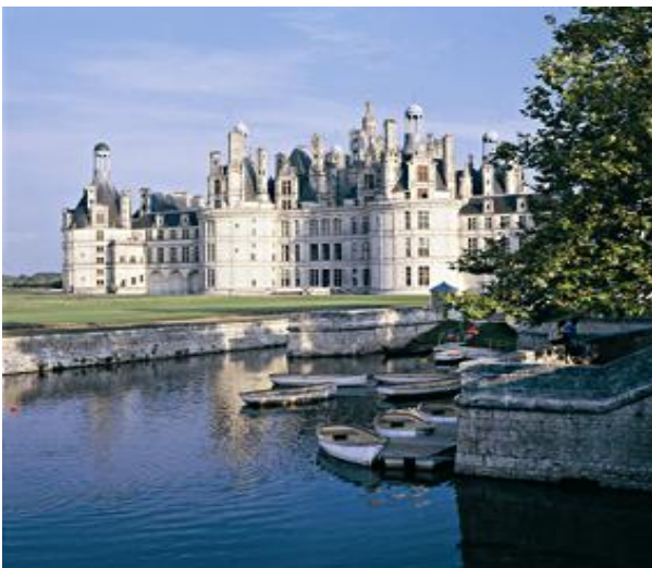
Chambord et ses barques

Le château de Chambord, chef d'œuvre de la Renaissance, se dresse dans une vaste forêt où résonne encore le brame du cerf. Rêve vivant de François I er , il fut selon la légende dessiné par Léonard de Vinci. Le souverain ne profitera pas longtemps de ce rendez-vous de chasse. À l'inverse, Louis XIV fit d'heureux séjours en ces lieux, aux rythmes des ballets de Lully et des représentations de Molière.