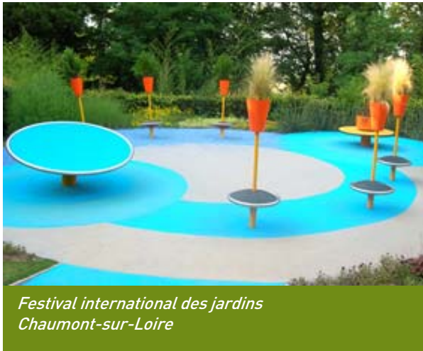
Festival international des jardins Chaumont-sur-Loire

Sur les bords de Loire, la mémoire est vivante ; elle cultive l'avenir. Ainsi le Festival de Chaumont-sur-Loire (de la fin avril à la mi-octobre) est devenu « le » rendez-vous des amateurs de jardins. Cet événement de renommée internationale est désormais la référence en matière d'expression et de création contemporaine.