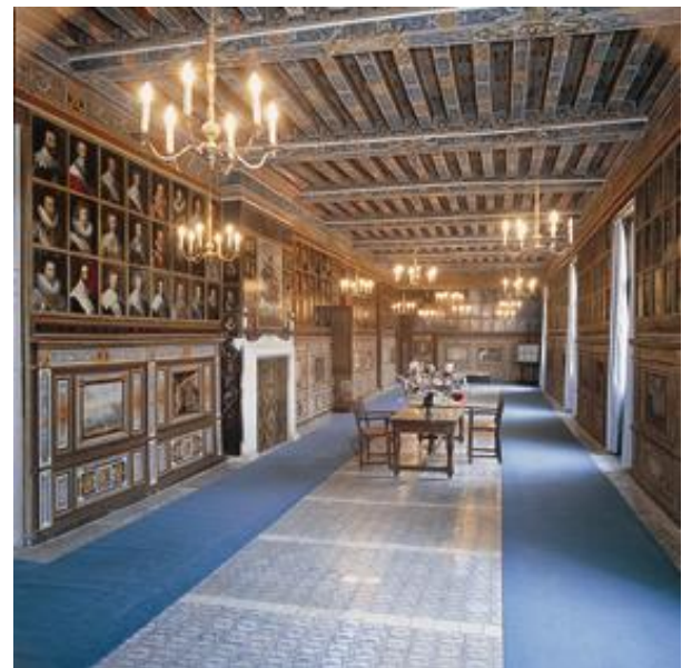
château de Beauregard – galerie des portraits

Plus au nord, la Commanderie d'Arville permet de revivre l'épopée des croisades. Au cœur de la Sologne, la parure de briques du château du Moulin se reflète dans l'eau de ses douves. Cette charmante demeure accueille désormais le conservatoire de la fraise. Enfin, tout au sud, sur les bords du Cher, à deux pas de Chenonceaux, s'élève la cité médiévale de Montrichard et son donjon.