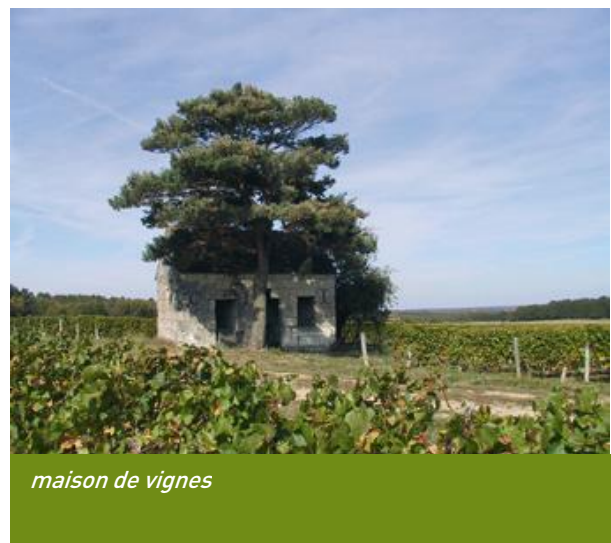
maison de vignes

Il convient ensuite de descendre jusqu'à Cheverny pour faire le tour des chais et goûter au « cour-cheverny », un vin blanc très particulier issu du romorantin, un cépage introduit par François I er en 1519.