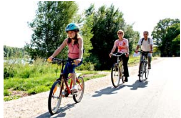
les châteaux à vélo - la Loire à vélo

Enfin c'est sur un futreau (embarcation traditionnelle à fond plat) que les marins d'eau douce pourront vivre au rythme de la Loire et accoster sur les grèves que découvre le fleuve. A moins qu'ils ne préfèrent visiter Vendôme en barque, au fil du Loir.