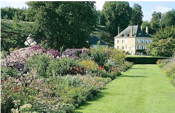
jardin du Plessis Sasnières

Prononcez le mot « jardin » et l'on vous répondra « festival » en référence au Festival International des Jardins de Chaumont-sur-Loire. Cette manifestation ne saurait toutefois faire oublier les parcs et jardins qui fleurissent nos chemins tout au long de l'année. Une quinzaine de sites vous ouvrent leurs portes pour vous faire partager leur passion, celle de l'art du jardin. Si certains de ces jardins sont intimement liés aux châteaux qu'ils entourent (Beaugard, Cheverny...), d'autres mettent à l'honneur la création contemporaine (le Plessis-Sasnières, le Prieuré d'Orchaise).